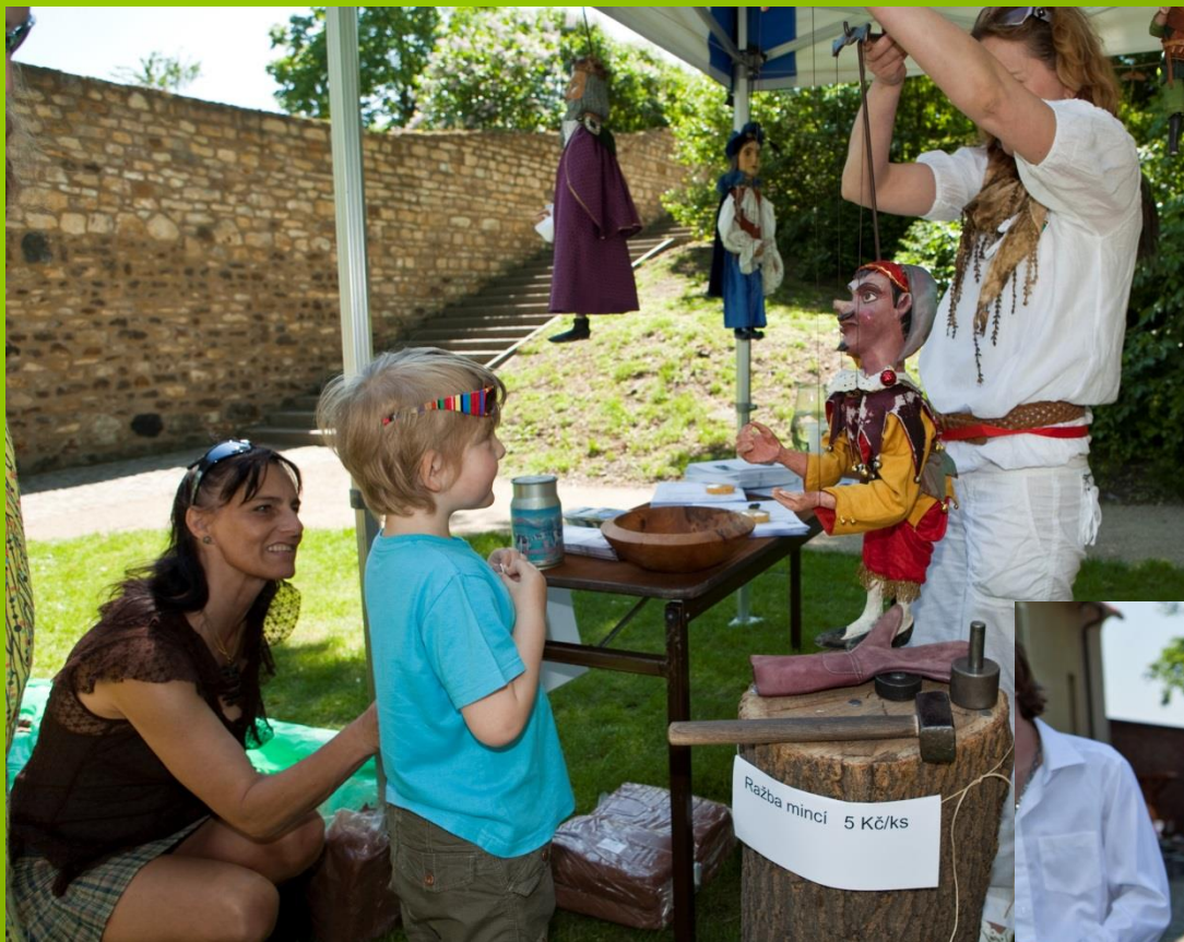
Dětský koutek plný loutek, Starých pověstí českých, Věstonických Venuší a vlastnoručně ražených mincí